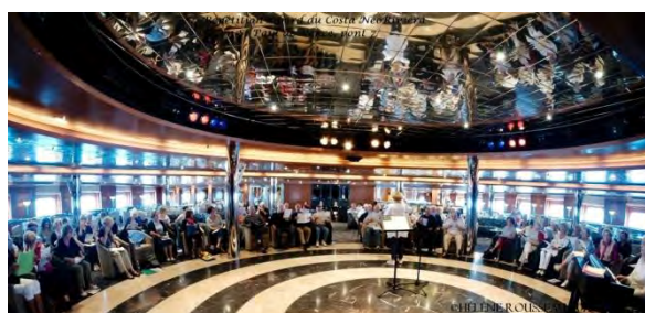
Répétition du chœur TMR à bord du Costa neoRiviera, Salon St Paul de Vence, pont 7