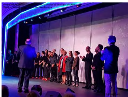
Présentation des artistes du XVI ème festival de Musique en mer Théâtre Ravello, ponts 5-6, Costa neoRiviera